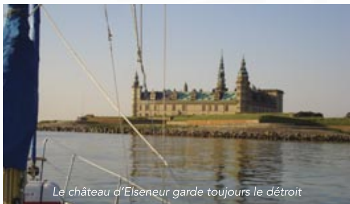
Le château d'Elseneur garde toujours le détroit