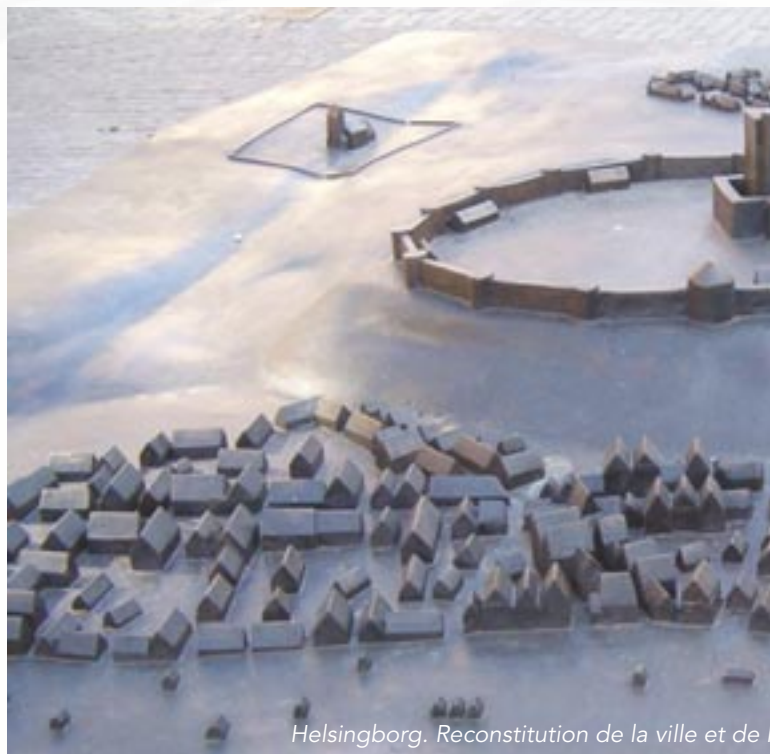
Helsingborg. Reconstitution de la ville et de

Il observait avec avidité tous les faits et gestes de son capitaine. Il ne comprit pas tout de suite pourquoi Vladislas avait ordonné de réduire la voile en relevant le point d'écoute alors que soufflait une brise vigoureuse et que la mer était calme à l'abri de l'île de Sjælland. De Traves Deern approchait du Sund. On voyait bien la rive basse d'Helsingør à l'ouest et les collines qui entouraient Helsingborg à l'est, moins d'une lieue séparait les deux villages. Une autre cogue suivait, trois autres étaient un peu attardées mais se rapprochaient. Juste avant le coucher du soleil, Vladislas fit larguer toute la voile et gréer les bonnettes : le mât et le gréement gémirent sous l'effort, la voile ronde comme un ventre de femme prête à donner la vie entraîna la cogue. Hans comprit que Vladislas avait l'intention de filer avant qu'on essaye de lui faire payer le moindre droit de passage. Pour l'instant la cogue fonçait vers le Kattegat. Quelques voiles rodaient dans le détroit, mais rien de menaçant pour les lourds vaisseaux hanséates. Les deux rives du détroit disparurent dans l'ombre et le bateau s'enfonça dans la nuit protectrice. Plusieurs années furent nécessaires pour que la marine danoise put enfin faire appliquer sa loi et percevoir un droit de passage dans le détroit, en attendant le mieux était de ne pas se laisser arraisonner par qui que ce soit.