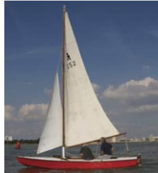
Patouche, Caneton Brix de 1932 entièrement restauré par la PETITE PLAISANCE en essais aux Minimes le 11 septembre 2016

Le Firefly : pendant la guerre, Fairey Aviation construisait des fuselages en bois pour les avions Mosquito. Après-guerre, son directeur imagina une production industrielle de dériveurs construits selon le même principe, des panneaux de tranché d'acajou posés en diagonale, façonnés dans un moule et collés à chaud en four autoclave.