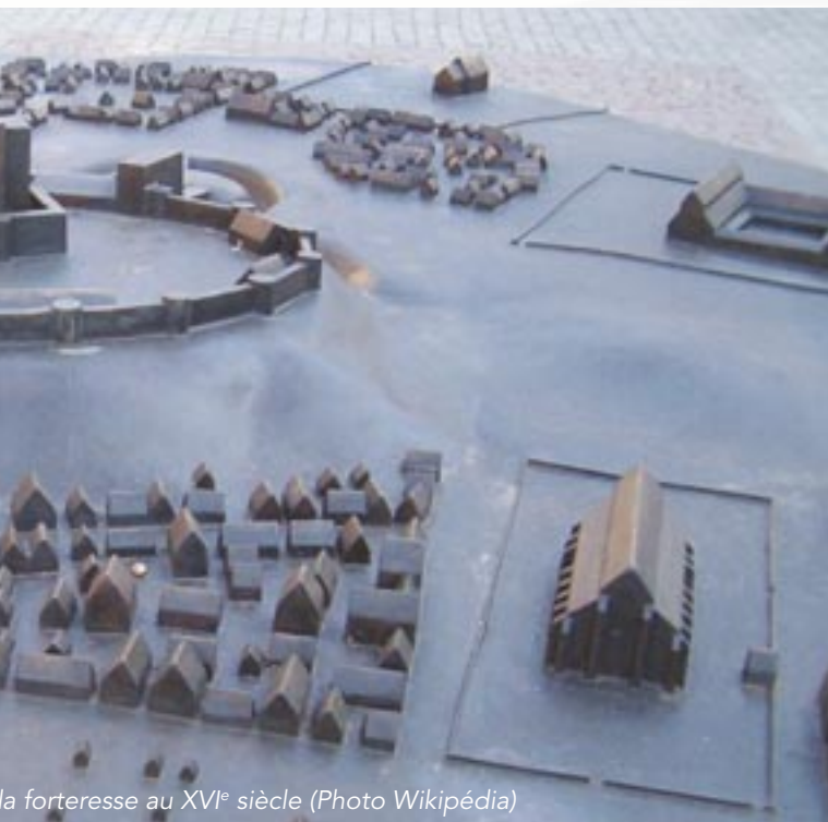
la forteresse au XVI e siècle

était Njörd, dieu de la mer et du vent. On respectait bien sûr les nouveaux saints chrétiens pour lesquels les villes construisaient de somptueuses églises mais on ne comprenait pas toujours bien leurs discours en latin et en mer avaient-ils réellement fait leurs preuves ? Plus sagement les pilotes se fiaient surtout à leur sens aiguisé de l'orientation, à l'observation du vent et de la mer: Les vagues et la houle ont une histoire, elles devançant souvent le vent et gardent la «mémoire» du vent qui les a soulevées : par exemple, une houle de Nord-ouest annonce un vent de nord-ouest. Le soleil et les étoiles donnent aussi des orientations précieuses quand le ciel accepte de coopérer: Les oiseaux, au moins ceux connus pour leur fréquentation habituelle des rivages, peuvent aussi renseigner. Deux heures plus tard, la sonde trouva le fond à 12 brasses, ce qui signifiait que la cogue avait dérivé vers l'ouest. Vladislas s'en doutait et en restant sur cette ligne de sonde, on avait des chances de trouver l'île. Il recommanda la vigilance car en approchant, les fonds remontaient très vite. En effet peu de temps après, la vigie signala qu'on voyait les forêts des hauteurs de l'île dont la ligne sombre se confondait avec le gris des nuages. «On va pas faire les malins ! dit