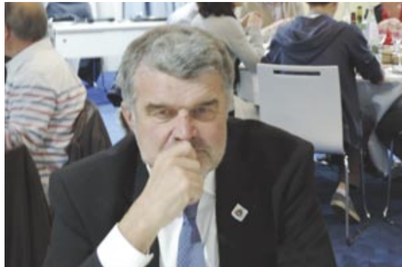
Jean-François Fountaine, maire de La Rochelle, lors d'un dîner-conférence des Amis