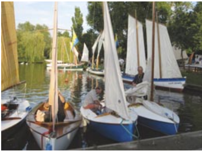
La PETITE PLAISANCE aux rendez-vous de l'Erdre en 2011, le 2 septembre 2011

sympathique génération de jeunes pousses qui sont à l'origine de la démocratisation des pratiques plaisancières avec : le Vaurien , le Mousse et quelques autres.