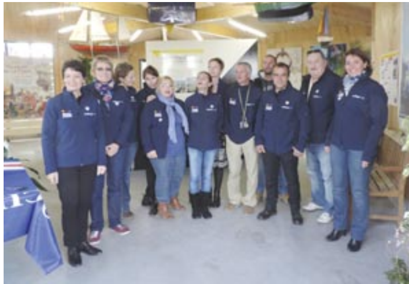
Le jour de l'inauguration de la galerie des pavillons, le 3 avril 2015, le personnel du musée attend les visiteurs