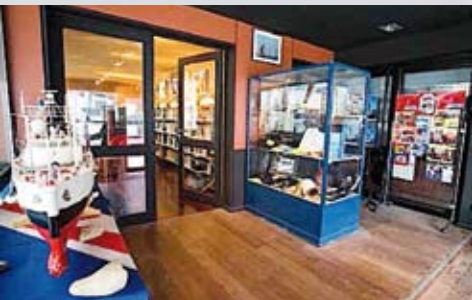
Le carré des Amis