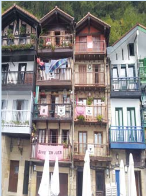
Donibane Kalea, unique rue de Pasai Donibane

Beaucoup d'entre nous sont déjà allés à San Sebastian. Généralement les touristes ne visitent pas le port de commerce : Pasajes. Le guide Michelin ne dit-il pas que «la côte est ici très abîmée par les infrastructures industrielles», ce n'est pas très encourageant ! Pourtant certains Rochelais, anciens marins notamment, connaissent bien ce port pour y avoir livré des ferrailles ou plus souvent... du poisson, ici, plutôt qu'à Chef-de-Baie. Si la pêche décline, Pasajes ou Pasaia en euskara importe toujours de la ferraille pour la sidérurgie basque et exporte les Volkswagen et les Mercedes construites dans la région. Mais tout cela se passe du côté de Pasajes San Pedro.