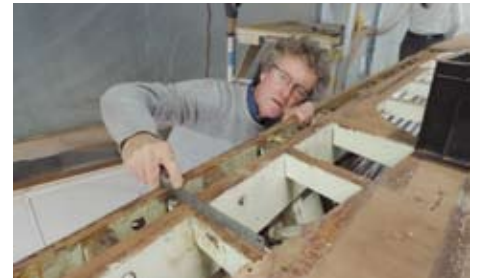
Le pont de Viola a été mis à nu pour une réfection complète

« J'ai d'abord squatté le Musée maritime puis j'ai été accueilli par le chantier naval Force 3 où je suis tou-