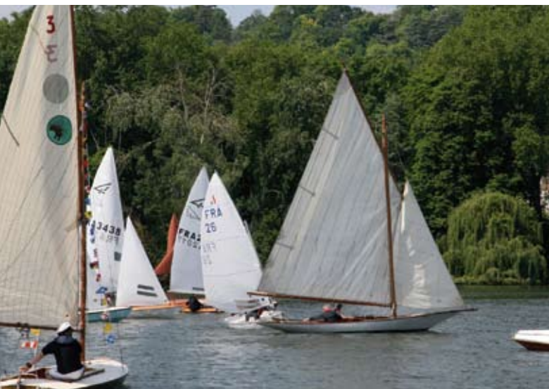
Roastbeef, un 30 m 2 de Gustave Caillebotte reconstruit par l'association Sequana ne fait pas que de la figuration sur une ligne de départ

Parmi les «Z'amis» et particulièrement à la «Petite Plaisance», quelques-uns s'enfoncent à l'intérieur des terres pour découvrir le patrimoine fluvial. En approfondissant leurs recherches, ils découvrent la genèse de la voile légère et apprennent que la Plaisance est née dans Paris intra-muros au début du XIXe siècle. Ces quelques Rochelais curieux ont noué des liens amicaux avec d'autres amoureux du patrimoine nautique, en particulier avec l'association Sequana de Chatou (Yvelines). Certain va même jusqu'à faire partie