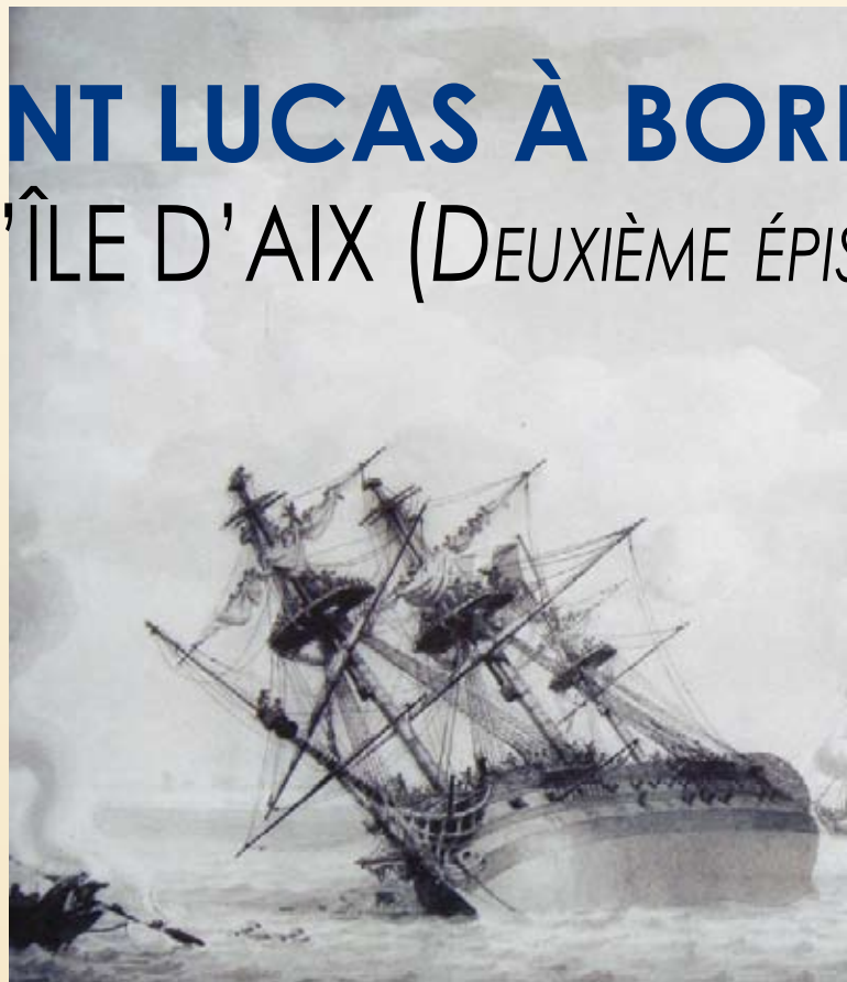
Combat héroïque du Régulus , Charles Fouquieray (1909), salle du conseil

Le 13 au soir la mer monta très haute ; le Regulus flottoit un peu. J'avois espoir à l'aide de mes voiles de me remettre entièrement à flot. J'y serois parvenu et j'y travaillois lorsque je reçus l'ordre de Mr l'Amiral de ne point entrer en rivière et celui de me tenir près de lui pour réunir mon feu à celui de l' Océan en cas d'une nouvelle attaque de la part