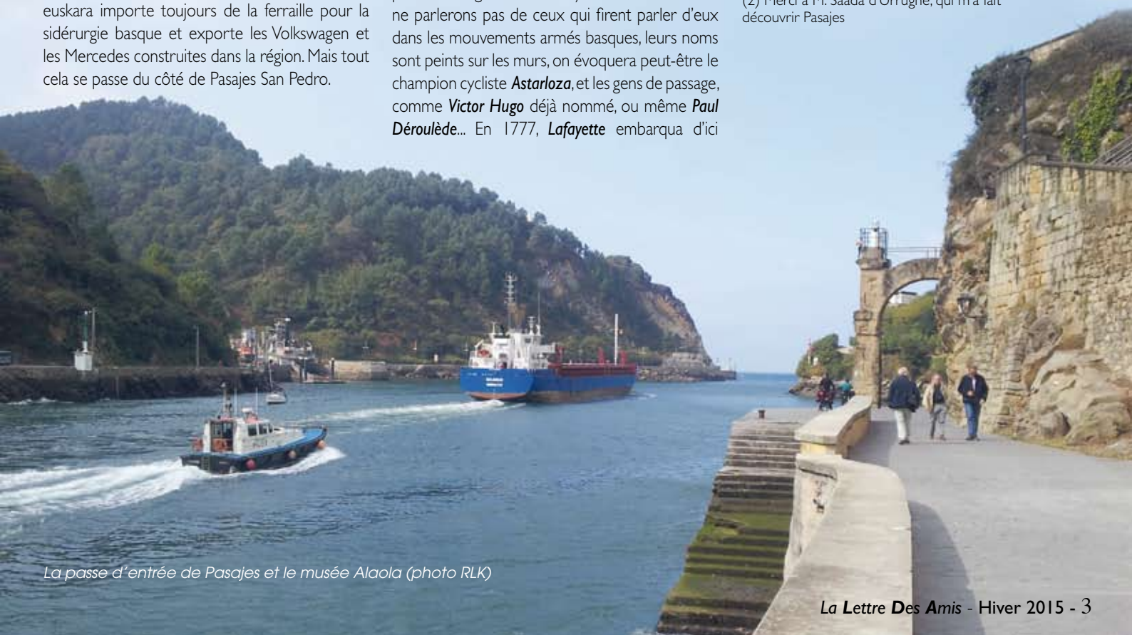
La passe d'entrée de Pasajes et le musée Alaola