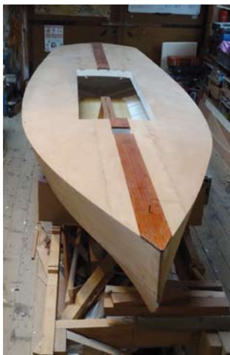
De la belle ouvrage : les dernières photos de la construction du monotype de Nogent