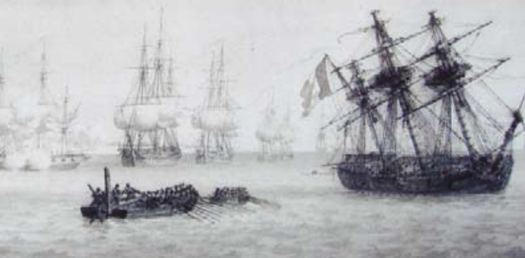
municipal de Fouras

matin ; alors le Regulus restait le seul fortement échoué sur les vases vis-à-vis de Fouras, à l'embouchure de la rivière de Rochefort, n'étant protégé par aucune batterie de la côte, ne pouvant présenter que la poupe à l'ennemi et ne lui opposer que les 6 canons de retraite. Toute cette journée la flottille anglaise qui me serroit de près fit de grandes dispositions pour m'attaquer, les trois brûlots furent mis en mouvement, plusieurs péniches furent disposées à les remorquer. Le flot et les vents d'ouest pouvoient les porter directement chez moi. Ne doutant pas que l'ennemi n'exécuta son projet vers le soir ou dans la nuit, je fis aussi toutes mes dispositions pour le repousser vivement, le combattre jusqu'à la dernière extrémité et enfin, pour assurer le salut de l'équipage dans le cas désespéré où nous eussions