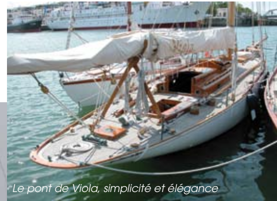
Le pont de Viola, simplicité et élégance