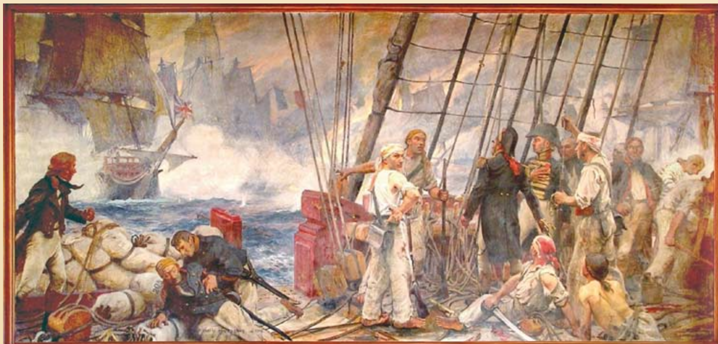
Combat héroïque du Régulus, Charles Fouqueray (1909), salle du conseil municipal de Fouras