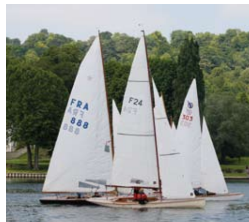
Plaisir des yeux : Aile, Star, Joli morgann et bien d'autres en régate à l'YCIF