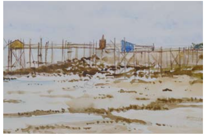
Par une belle matinée d'octobre 2011, les aquarellistes peignent les carrelets de la plage de la Platère à marée basse.