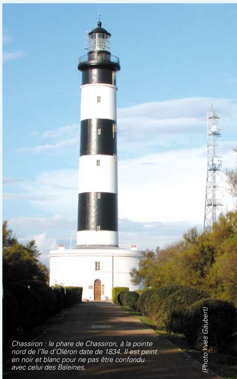
Chassiron : le phare de Chassiron, à la pointe nord de l'île d'Oléron date de 1834. Il est peint en noir et blanc pour ne pas être confondu avec celui des Baleines.