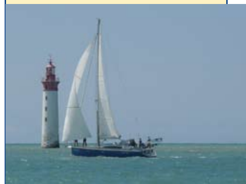
Photo : Sortie dans le pertuis organisée par Vogue et Rêve , passage devant le phare de Chauveau.