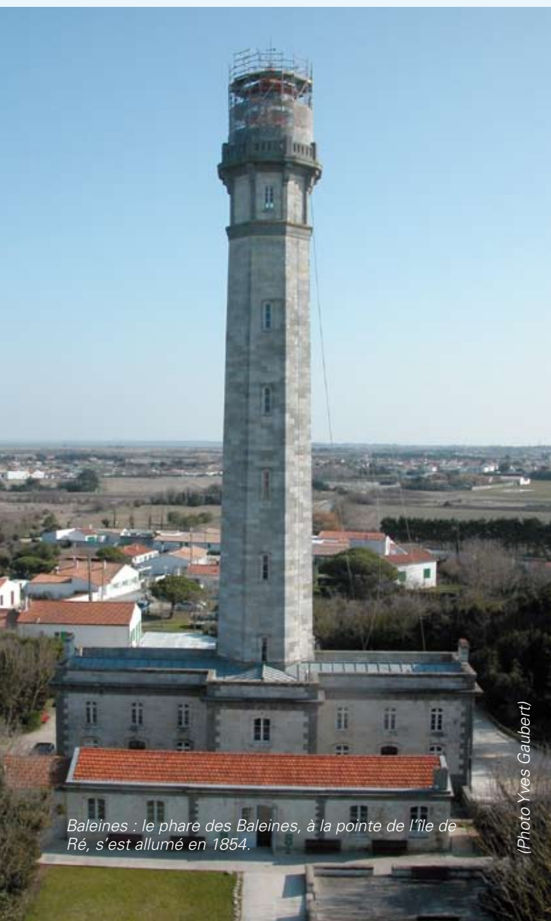
Baleines : le phare des Baleines, à la pointe de l'île de Ré, s'est allumé en 1854.

Des innovations techniques vont se succéder. Les lampes munies de becs à huile et de réflecteurs métalliques choisies pour l'éclairage public des réverbères en 1764 sont adoptées pour les phares. En 1782 la lanterne de Cordouan est la première à être équipée de 80 réverbères de cuivre argenté où brûle un mélange d'huiles animales et végétales. La lanterne est vitrée pour la protéger des intempéries et pourvue du mouvement rotatif d'horlogerie, innovation suédoise au phare de Marstrand en 1780. Chaque phare a ainsi une identité propre caractérisée par son clignotement et son scintillement.